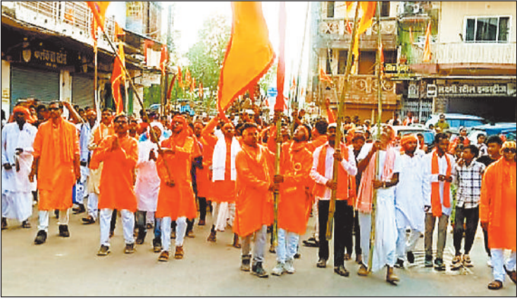
भगवा झंडे के साथ शोभायात्रा में शामिल रामभक्त।

नगर में लगे भगुआ झंडे से शहर हुआ राममय, गूंजता रहा जय जय श्रीराम के नारे