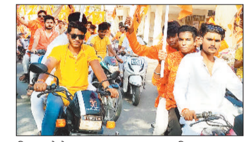
थिरक रहे थे राम भक्त भगवा वस्त्र धारण किए हुए एक ड्यूस में काफी मनमोहक नजर आ रहे थे। पथलगांव पुलिस भी दिखी चुस्त सुबुठ से ही शहर में गस्त करती रही शाम साढ़े चार बजे से रात साढ़े नौ बजे तक के लिए सड़कें वाहनों को शहर से बाहर ही रोक दिया गया था। रात्रि को रामनवमी के शुभ अवसर पर श्री राम सेवा समिति ने बस स्टैंड में महा आरती का आयोजन धूमधाम से किया इस आयोजन को देख कर शहर के साथ आसपास के गांव वाले काफी दूर दूर से पहुंचे थे शहर में हुए इस भव्य आयोजन को शहर के सभी लोगों ने खुब सराहा।

पथलगांव। रामनवमी के शुभ अवसर पर शहर में पथलगांव के तीन गांवों में निकली भव्य श्री राम भगवान की झांकी शाम के साढ़े चार बजे सत्यनारायण मंदिर से धूमधाम के साथ निकली श्री राम भगवान की झांकी इस झांकी में केज में लगे गये डीजे को देखने शहर वारी सड़कों में खड़े रहे वावर सेना, के साथ शहर के लोग बाजे गाजे के साथ सड़कों में नाचते गाते देखे गए पथलली बार पथलगांव शहर में इतना भव्य श्री राम भगवान की झांकी निकली जिसके लिए महीने भर से श्री राम सेवा समिति के लोग जो जान से जुटे हुए थे सभी ने रात दिन एक कर रामनवमी के झांकी को भव्य बनाने में लगे रहे शहर के लोग इस रामनवमी के झांकी को देखने काफी दिन से इंतजार कर रहे थे। बाइक रैली में सैकड़ों लोगों ने निमाई अपनी हिस्सेदारी। रामनवमी के अवसर पर राम भक्तों ने बाइक रैली डीजे की धुन पर निकली बाइक रैली में राम भक्त जय श्री राम के नारे लगाते हुए डीजे की धुन पर