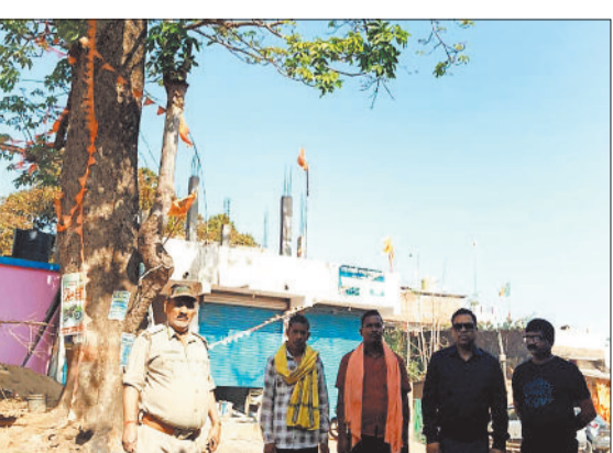
एक्सपर्ट टीम द्वारा मधुमक्खियों के हटाए जा रहे छत्ते।

जशपुरनगर। जिला मुख्यालय सहित पथलगांव, कांसाबल और कुनकुरी, बगीचा विकासखण्ड में मधुमक्खियों के अनगिनत छत्तों को लेकर आम लोगों के साथ ही खास लोगों में बढ़ती असुरक्षा को देखते हुए डीएफओ की पहल पर जिला प्रशासन ने महत्वपूर्ण कदम उठाए हैं। इसी कड़ी में आज बगीचा नगरीय क्षेत्र में एसडीएम, सीएमओ एवं वन विभाग के अधिकारियों की उपस्थिति में मधुमक्खी छत्ता निकालने का कार्य बाहर से आए एक्सपर्ट टीम के द्वारा प्रारंभ कर दिया गया है। कुछ दिन एक्सपर्ट टीम जिले में ही रहेंगे तथा मधुमक्खी छत्ता निकालने जैसे कार्य करेंगे।