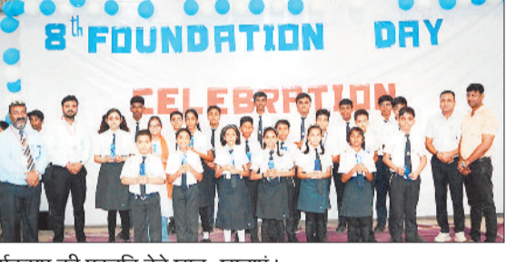
कार्यक्रम की प्रस्तुति देते छात्र-छात्राएं।