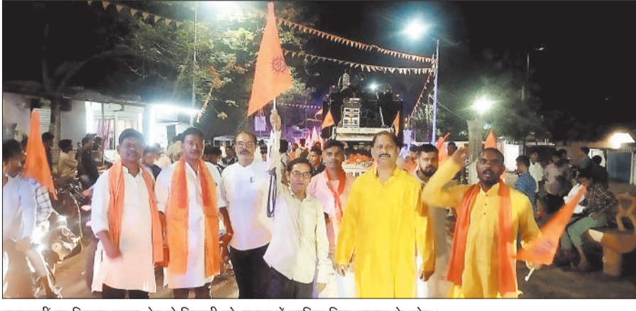
रामनवमी पर शिवपुर चरचा क्षेत्र से निकली शोभायात्रा में शामिल हिन्दू समाज के लोग।

चैत्र नवरात्र एवं राम नवमी पर्व को लेकर क्षेत्र में शोभायात्रा निकाली गई। नगर पालिका शिवपुर चरचा क्षेत्र में मंगलवार को महाअष्टमी के दिन सभी मंदिरों में प्रातः काल से ही पूजा-अर्चना प्रारंभ हुई, जहां हजारों श्रद्धालुओं ने सुबह से शाम तक पूजा-अर्चना करते नजर आए। महाअष्टमी के अवसर पर सर्व हिन्दू समाज द्वारा शाम को हेलीपैड ग्राउंड से चैत्र नवरात्र एवं रामनवमी पर्व को लेकर शोभायात्रा निकाली। यह यात्रा रेलवे ग्राउंड से विवेकानंद, सुभाषनगर, महाराणा प्रताप, नेपाल गेट, क्लैटोसी कालोनी होते हुए हनुमान मंदिर प्रांगण पहुंची, जहां सैकड़ों श्रद्धालुओं ने जय श्रीराम के नारों व डीजे की धुन पर यात्रा निकाली।