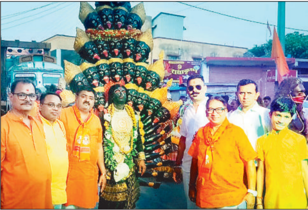
पथलगांव। शोभायात्रा में मां काली के स्वरूप के साथ शामिल भक्त।