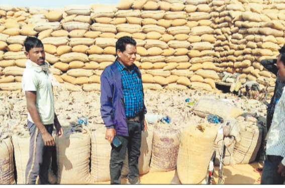
समिति पेटला में तहसीलदार साहब द्वारा धान खरीदी का निरीक्षण करते हुए।

धान खरीदी बंद हुए ढाई महीने गुजर गए हैं लेकिन अभी तक विपणन संघ समितियों में खुल आसमान के नीचे पड़े संपूर्ण धार का उठाव नहीं कर सका है। अभी भी एकूकृत सरगुजा के विभिन्न जिलों में 5 लाख 75 हजार 197 विंटल से अधिक धान के उठाव का इंतजार किया जा रहा है। विलम्ब से धान का उठाव करने से अब हर बोरे के वजन में कमी आ रही है जिसके कारण विवाद की स्थिति निर्मित हो रही है।